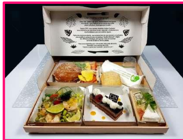
Présentation des Gourmets Occitan, Végé, Eco, Chaud et Voyage