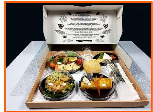
Présentation du Gourmet Luxe