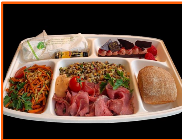
Présentation du Gourmet Jour